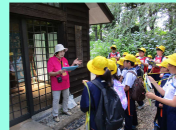
地域ウォーク【黒羽地区】