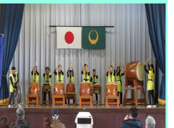
農民道全一太鼓【両郷地区】