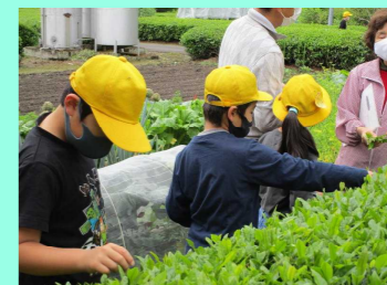
茶摘み体験【須賀川地区】