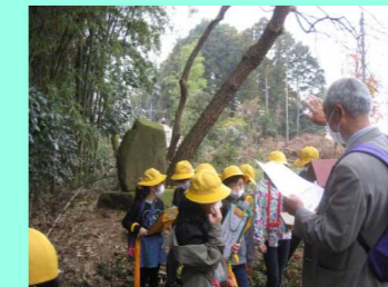
地域探訪【川西地区】